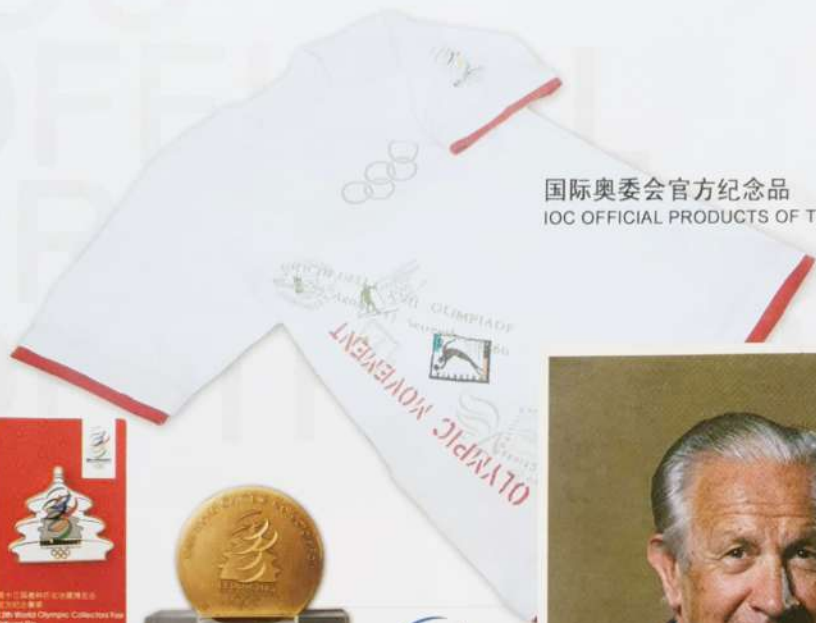
国际奥委会官方纪念品 IOC OFFICIAL PRODUCTS OF THE FAIR