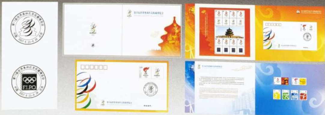
北京市邮票公司产品