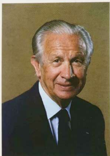
Juan Antonio Samaranch IOC Honorary President